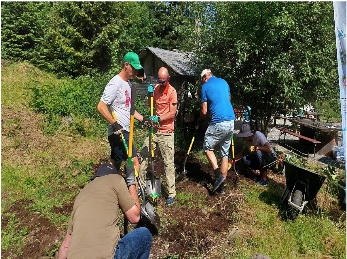
Illustration 1: Un chantier d'éco volontariat avec des employés de Siemens en 2023 à Pont de Nant.

Le projet est en cours de réalisation. Le première atelier participatif pour définir le design de la plateforme a été organisé par l'équipe de J42 à Lausanne le 2 octobre 2024.